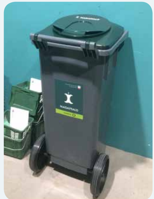
140 liter beholder til madaffald. Særligt dobbeltlåg med rundt låg øverst.

Hvis I ikke selv kan vaske beholderen, så kan I købe en vask i selvbetjeningen. Se priserne på hjemmesiden.